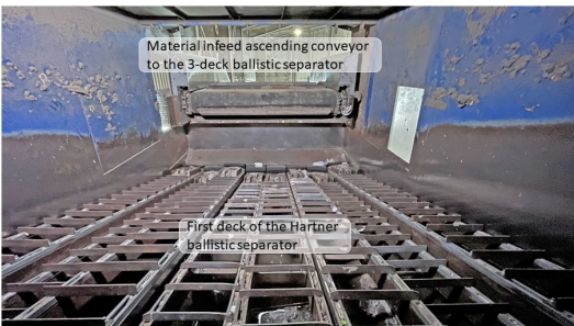
Hartner 3-deck ballistic separator