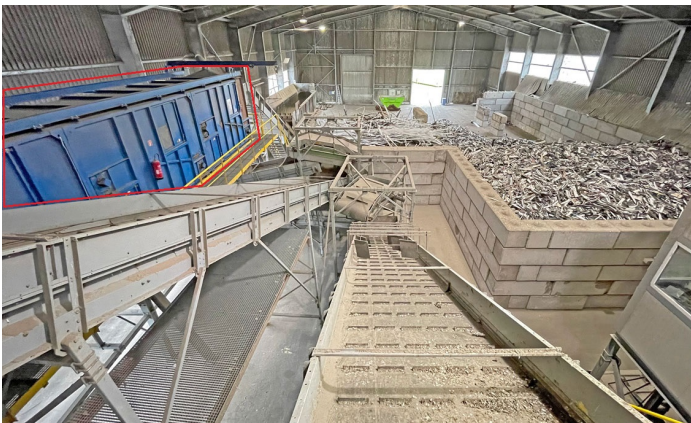
Hartner 3-deck ballistic separator