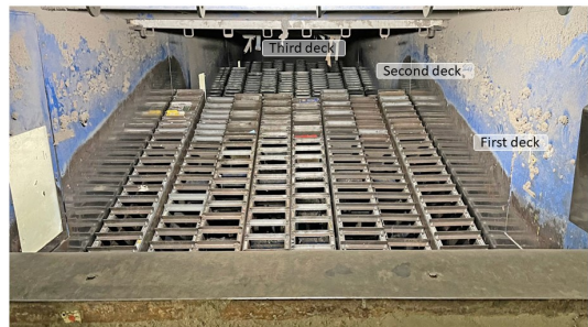
Hartner 3-deck ballistic separator